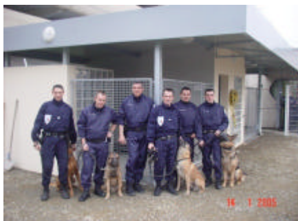
La SUGE et la Police : du bon travail

Des opérations menées conjointement avec la police nationale sont organisées régulièrement. Il est intéressant pour nos partenaires de voir évoluer leur chien dans le domaine ferroviaire et à contrario pour nos agents sur les méthodes et professionnalisme à adopter face à nos exigences.