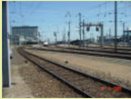
La gare de Nantes